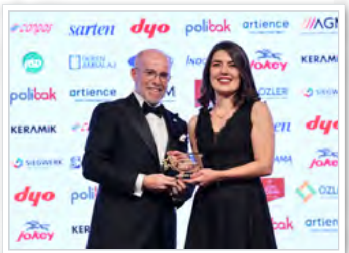
Ödül Alanlar Winners