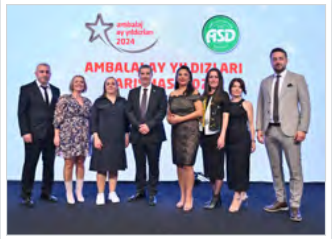
ASD Ekibi ASD Team