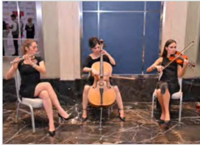
Ödül Töreni Kokteyli Awards Ceremony Reception