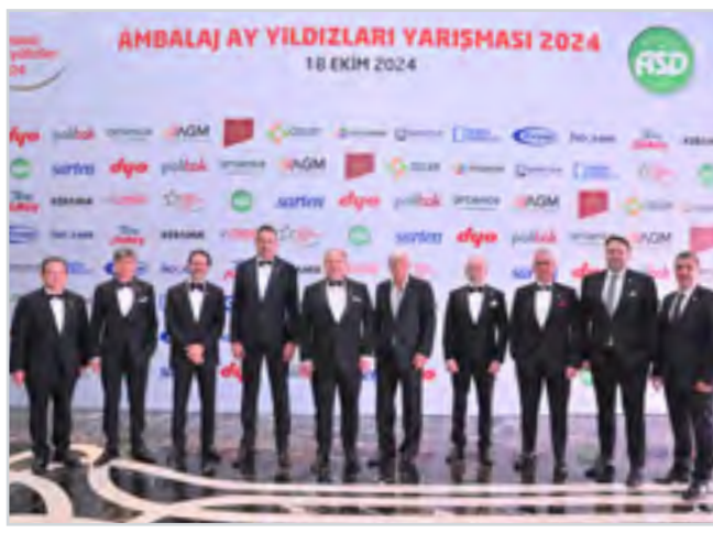
ASD Yönetim Kurulu ASD Board of Directors