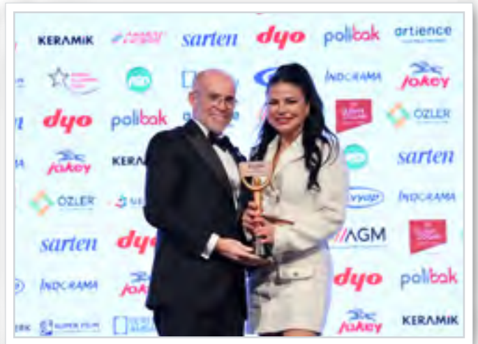
Ödül Alanlar Winners