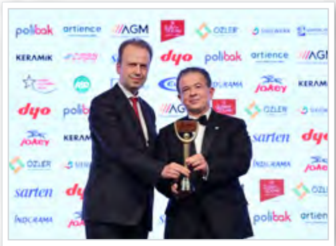
Ödül Alanlar Winners