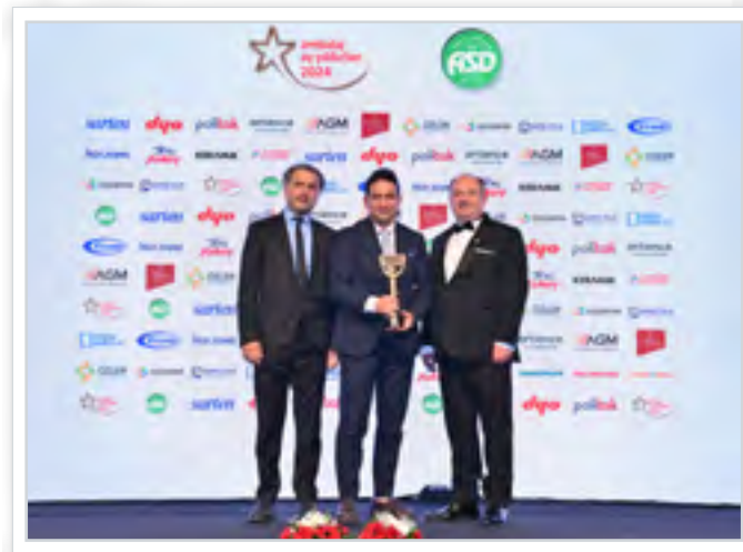
Ödül Alanlar Winners