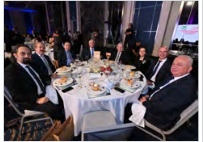
Ana Sponsor Sarten Main Sponsor Sarten