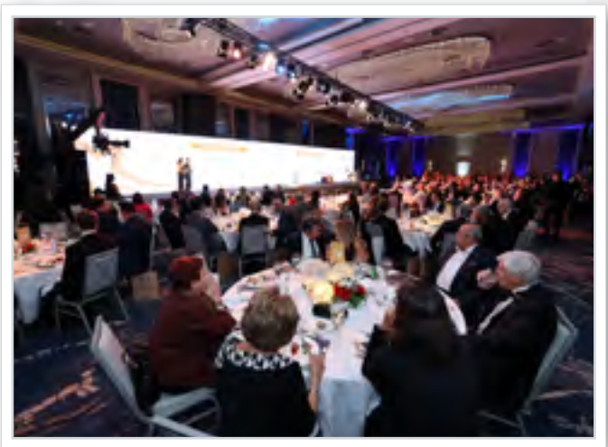
Gala Yemeğinden Kesitler Views from Ceremony Dinner