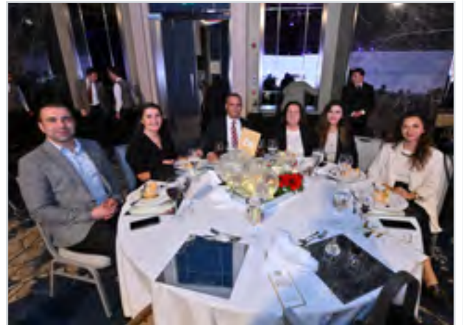
Gala Yemeğinden Kesitler Views from Ceremony Dinner